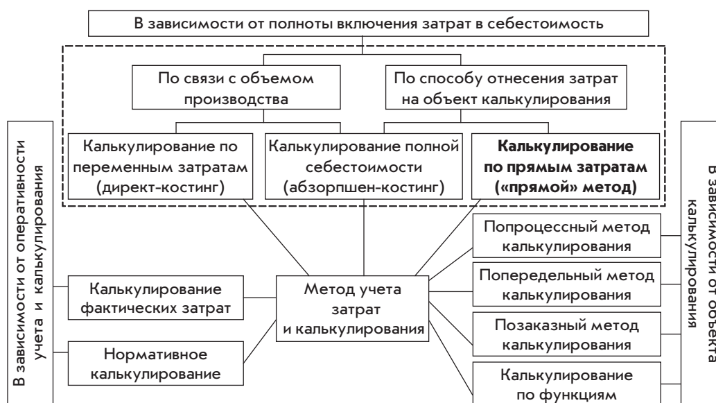
Рис. 2. Уточненная классификация методов учета затрат и калькулирования себестоимости продукции (работ, услуг)